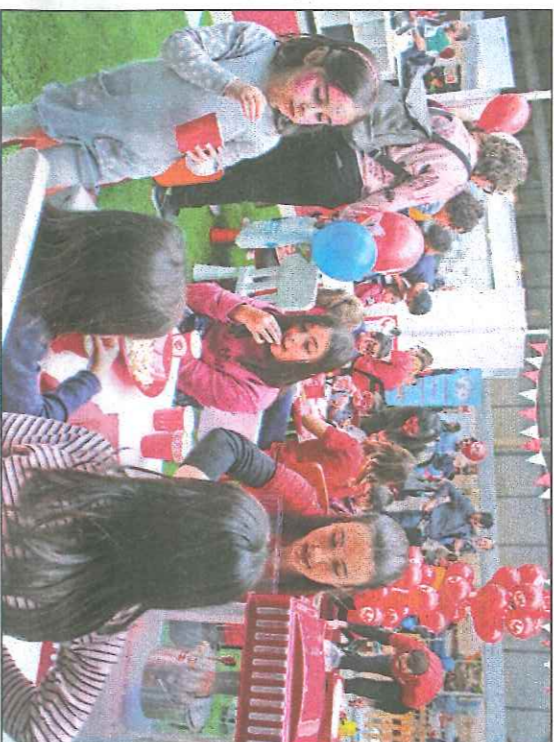
Els nens podran gaudir fins avui de diferents tallers

"Amb el benestar emocional, la persona brilla més". Aquesta és una de les conclusions exposades