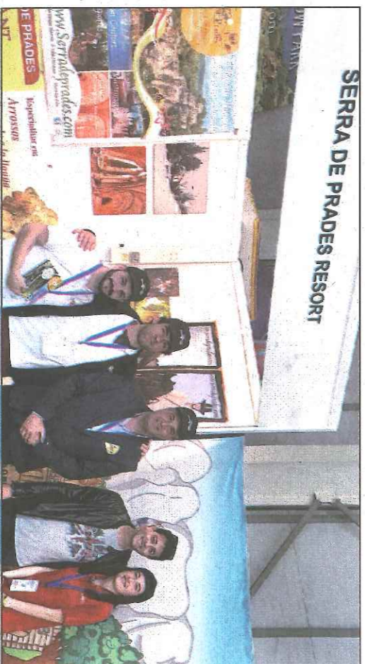
SERRA DE PRADES RESORT. Camping Resort, cap de setmana en un bungalow per a 4 persones, més un massatge, més un passeig amb pony, per 160 euros. Telèfon: 977 869 050 www.serradeprades.com