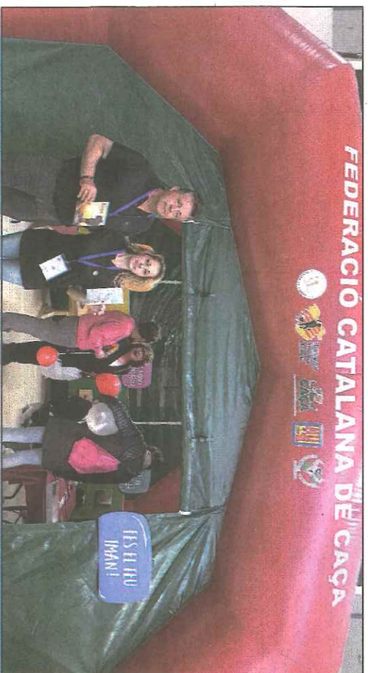
FEDERACIÓ CATALANA DE CAÇA. La FCC fent formació i pedagogia al voltant del món de la caça al STM. www.federat.cat