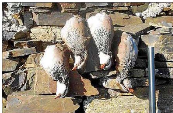
Capturas. Los cazadores deben cumplir con un máximo de piezas cazadas