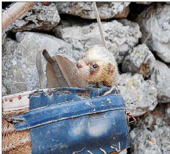
Este es el gran aliado. Un hurón sale de la huronera para cazar conejos